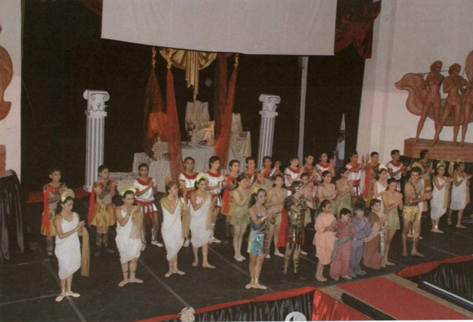
BALLET FOLKLÓRICO AYMARA, DEL GRUPO DE DANZA DEL CUDIC.