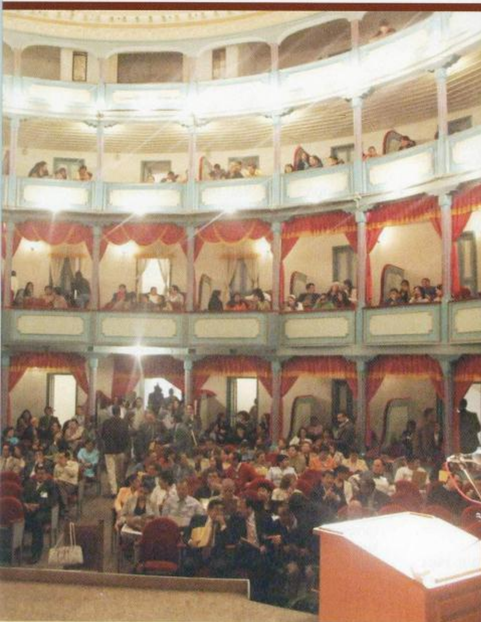
INTERIOR DEL TEATRO UNIVERSITARIO BOLÍVAR