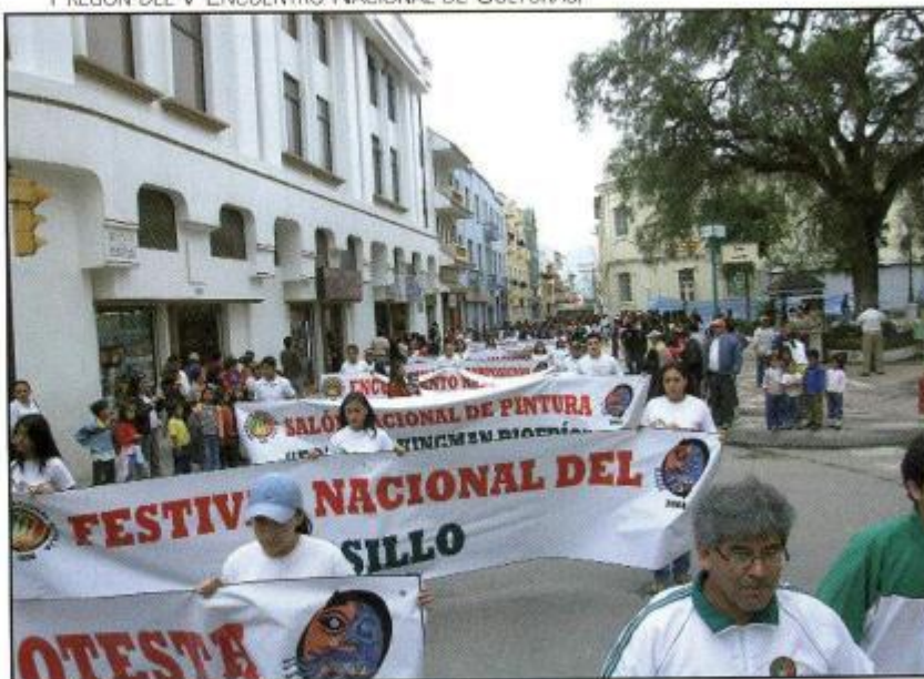
PREGÓN DEL V ENCUENTRO NACIONAL DE CULTURAS.

De otro lado, la UNL, consciente de que la rica diversidad cultural del Ecuador debe ser aprovechada en la construcción de una identidad nacional respetuosa de las diferencias y los derechos de todos los miembros de la sociedad, desde el mes de mayo del año 2000, ha