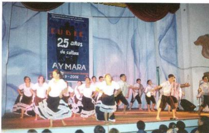
GRUPO DE DANZA AYMARA, PRESENTACIÓN DEL BALLEFOLKLÓRICO, TEATRO UNIVERSITARIO BOLÍVAR.

Con la ejecución de estos Encuentros Nacionales de Culturas , la Universidad Nacional de Loja le apuesta a la teoría y práctica de la interculturalidad no sólo como instrumento privilegiado sino insoslayable de desarrollo humano integral y sostenible de un país mega diverso como el Ecuador. Como lo dice el Dr. Noé Bravo Vivar, Coordinador del Quinto Encuentro Nacional de Culturas, "ni utilizar al otro ni ser utilizado por él. Colaborar. Esta parece ser la clave". Y, viabilizar la colaboración entre actores de las diferentes culturas, potenciar la interculturalidad es lo que se proponen los Encuentros Nacionales de Culturas, cuya quinta edición se llevó cabo entre el 28 de abril y el 6 de junio del 2008, bajo el ya emblemático lema: "La diversidad cultural es nuestra identidad".