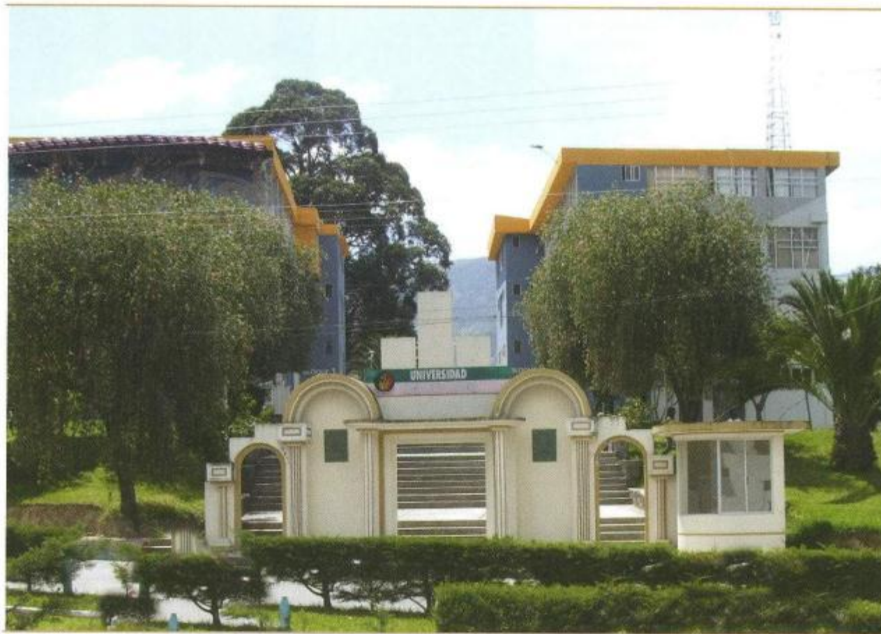
ACCESO PRINCIPAL A LA CIUDAD UNIVERSITARIA "GUILLERMO FALCONI ESPINOSA" Y EDIFICIOS DE LA ADMINISTRACIÓN CENTRAL.