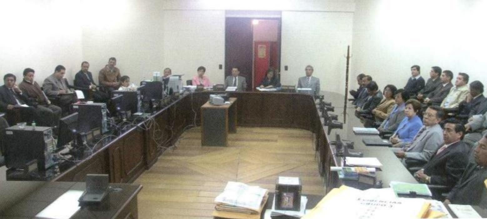
AUDITORIO "ENRIQUE AGUIRRE BUSTAMANTE". AUTORIDADES Y FUNCIONARIOS DE LA UNL RECIBEN A LOS EVALUADORES DEL CONEA.

de trabajo que implican cada una de ellas, en los términos que prevé el Reglamento de Régimen Académico para el Sistema Nacional de Educación Superior (Arts. 104 y 18); ello contribuirá a facilitar la movilidad de los estudiantes dentro y fuera del país.