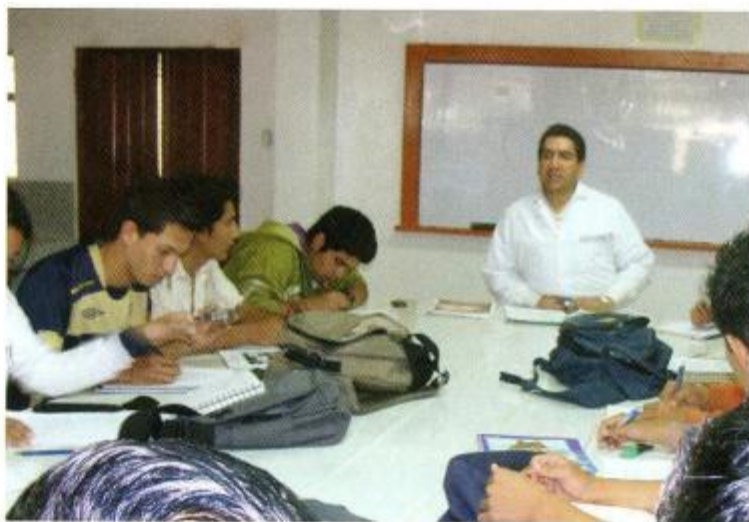
ESTUDIANTES DEL AARNR CON SU PROFESOR.

En la actualidad, la UNL ofrece estudios en distintos campos del conocimiento de las áreas: Agropecuaria y Recursos Naturales Renovables; Salud Humana; Educación, Arte y Comunicación; Energía, Industrias y Recursos Naturales No Renovables; Jurídica, Social y Administrativa. En la actualidad ejecuta 7 carreras de nivel tecnológico, en las modalidades presencial y semi-presencial; 37 carreras de tercer nivel o pregrado (35 en la modalidad presencial y 10 a distancia); y, 21 programas de postgrado a nivel de diplomado, especialidad y maestría, en las modalidades presencial, semi-presencial y a distancia (UNL, 2009. Ver anexo). Con estas carreras y programas, atiende a 22.000 estu-