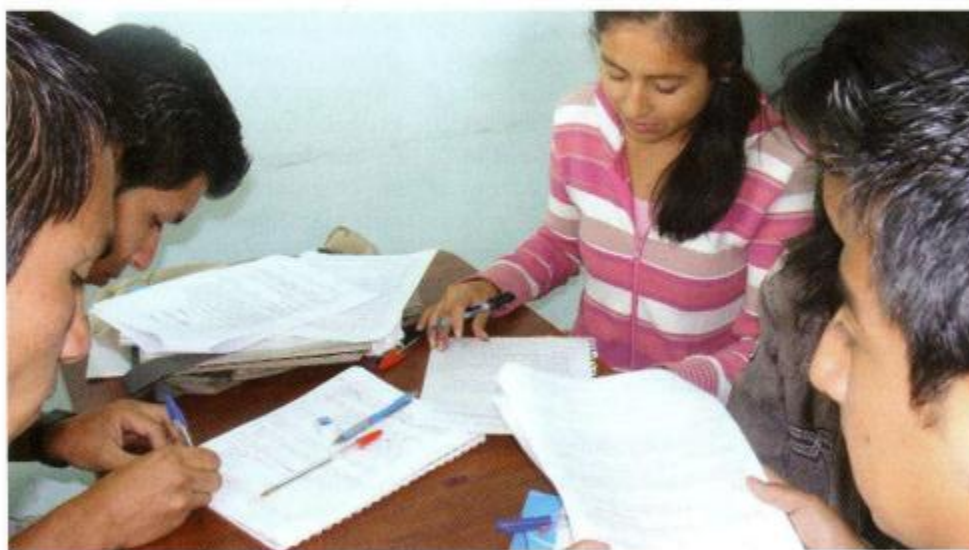
EL TRABAJO EN EQUIPO ES PARTE ESENCIAL DEL APRENDIZAJE.

Complementariamente, el currículo de todas las carreras y programas debería incluir un espacio formal para realizar la práctica integral (praxis) de la profesión, de manera planificada, organizada y