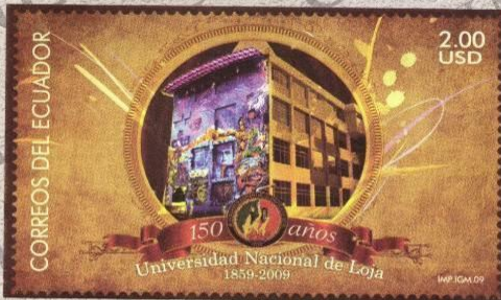
Sello Postal de la Universidad Nacional de Loja, emitido por la Empresa Nacional de Correos de Ecuador