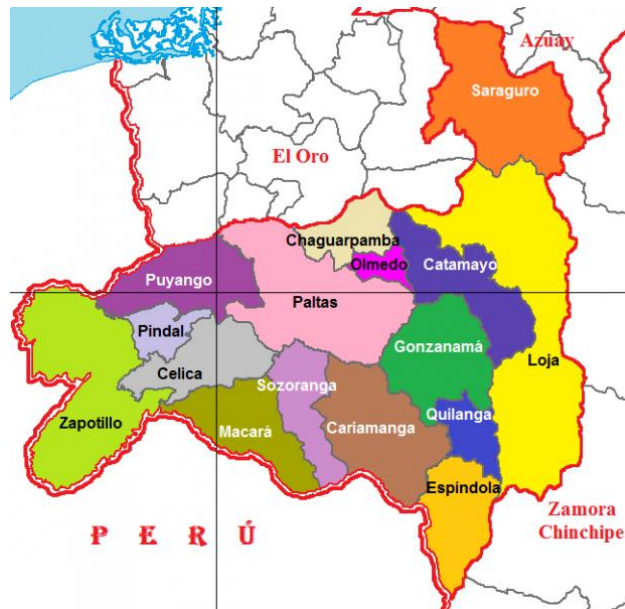
Figura 1 Cantón Loja

Nota: Esta figura describe la ubicación del cantón Loja dentro de la provincia de Loja, tomado del Plan de Desarrollo y Ordenamiento Territorial de la Provincia de Loja, publicado por la Prefectura de Loja (2015)