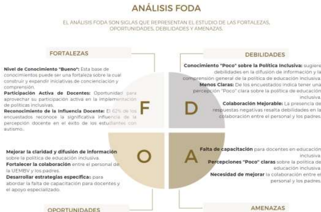
Figura 3. Matriz FODA

Necesidad de Mejorar Colaboración: La identificación de la colaboración como mejorable y las respuestas negativas destacan una amenaza potencial para un entorno de apoyo integral. Problemas en la colaboración pueden afectar negativamente la implementación de políticas inclusivas.