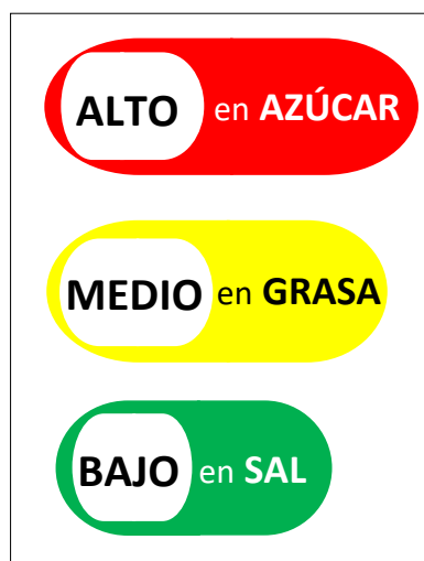
Figura 1. Representación gráfica del semáforo

En 2013, Ecuador se convirtió en el primer país de América Latina en implementar el etiquetado nutricional gráfico de tipo semáforo, de manera obligatoria en sus etiquetas de alimentos procesados, con el objetivo de garantizar a su población una información adecuada, clara y precisa sobre el contenido nutricional de los alimentos que consumen, facilitándoles el acceso a una elección saludable de los alimentos que adquieren; las especificaciones de la etiqueta que debe usarse en los productos se muestran en la Figura 1 y Cuadro 1 mismas que indican los niveles alto, medio y bajo de grasa, azúcar o sal presentes en los alimentos procesados (Galarza, G., Robles, J., Chávez, V., Pazmiño, K., y Castro, J. 2019).