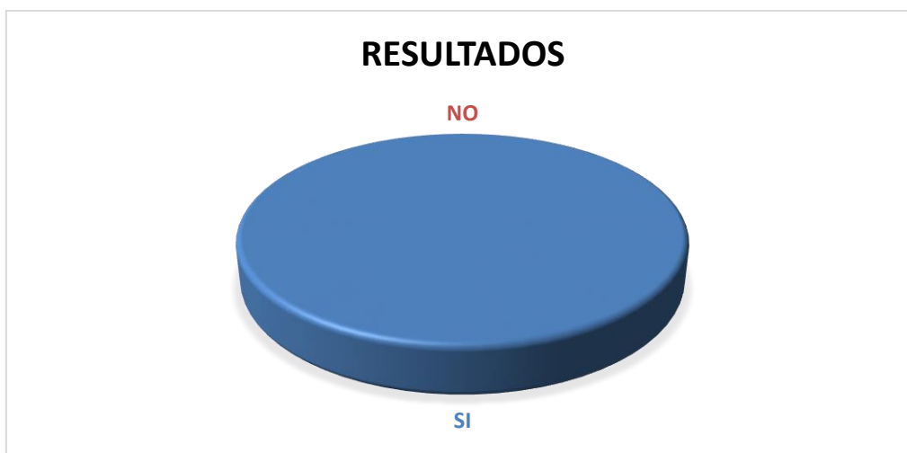
GRÁFICO N° 1

FUENTE: Abogados en libre ejercicio AUTORA: Aynee Solange Rojas Vélez