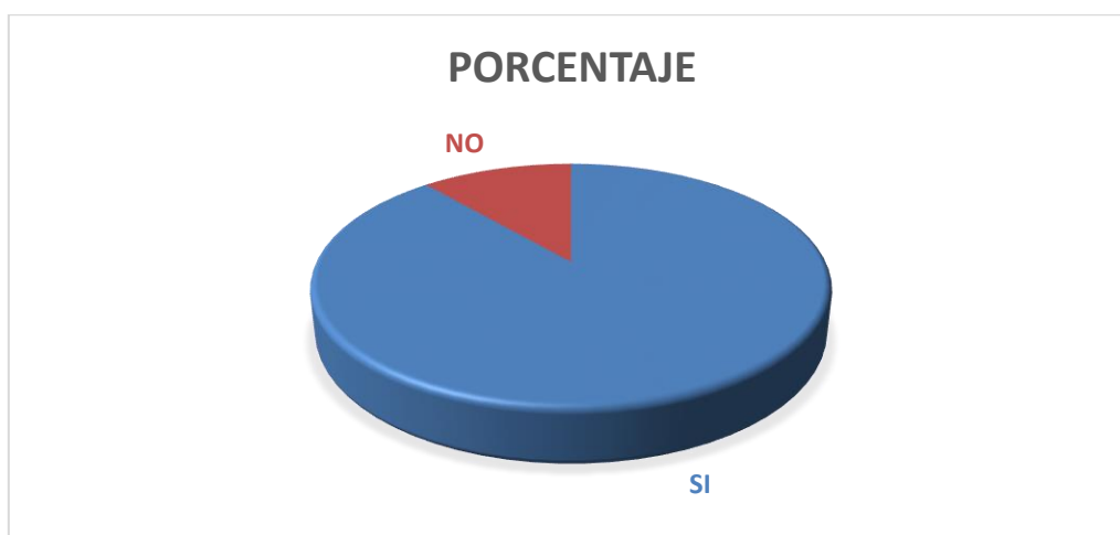
GRÁFICO Nº 3

AUTORA: Aynee Solange Rojas Vélez