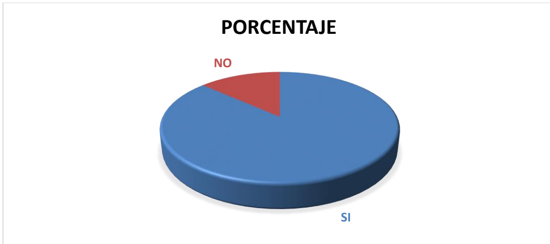
GRÁFICO Nº 5.1

De ser positiva su respuesta, como debería darse la dosimetría: