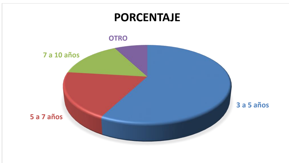
GRÁFICO Nº 5.2