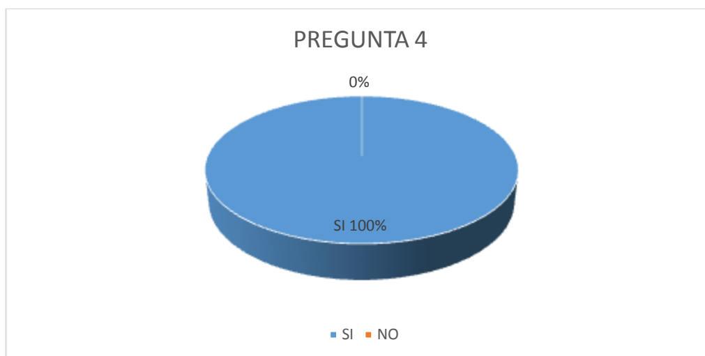
Grafico No. 4