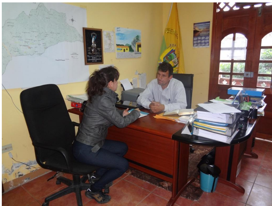
Fotografía No. 1: Entrevista con el presidente de la Junta Parroquial de Malacatos