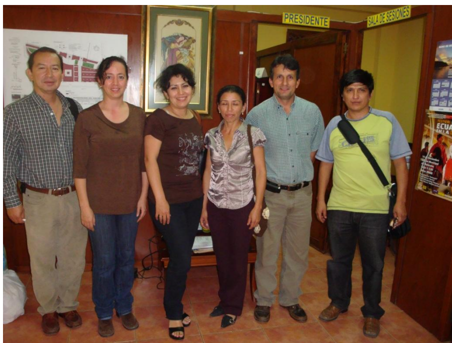
Fotografía No. 2: Miembros de la Junta Parroquia Malacatos.