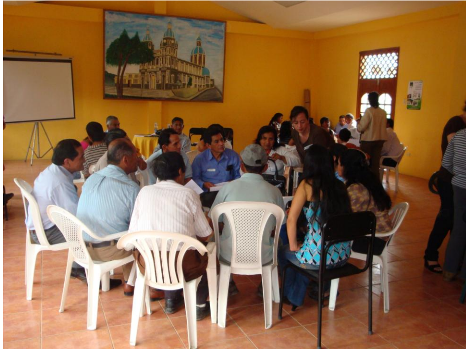
Fotografía No. 3: Aplicación de encuestas a representantes de comunidades