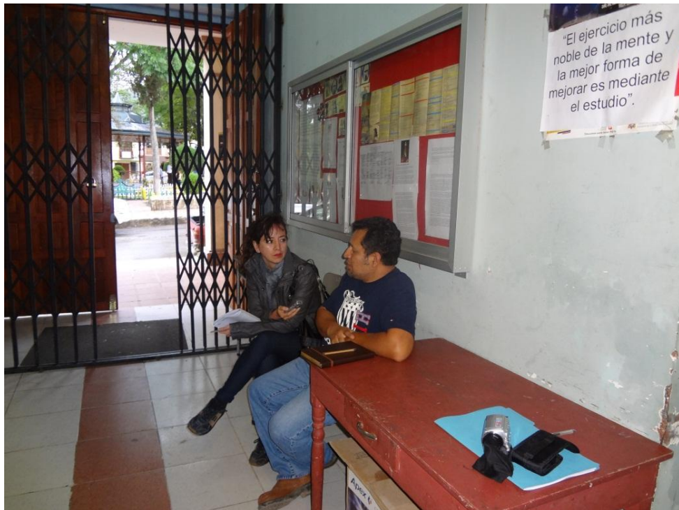
Fotografía No. 4: Entrevista a fiscalizador de la Consultoría del Plan de Desarrollo Parroquial de Malacatos.