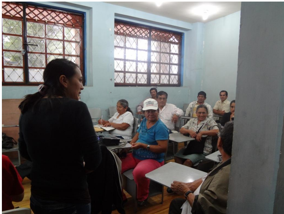
Fotografía No. 6: Formulación del Plan de Desarrollo Parroquial.