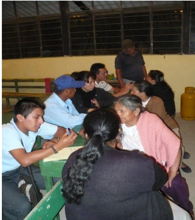
Fotografía No. 5: Encuestas a habitantes de la parroquia Malacatos