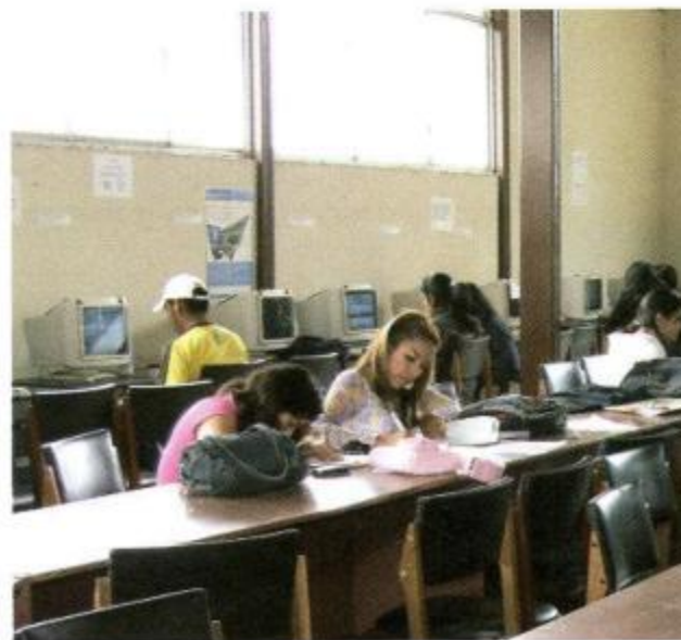
ESTUDIANTES DEL ÁREA DE SALUD HUMANA.

atención a la salud humana, todo lo que se debería y se desearía hacer. Y es que, evidentemente, la responsabilidad de la Universidad y del Área, aunque no se agota, se centra principalmente en la formación profesional, en la investigación. Las políticas en cuanto a la atención a la salud vienen del Estado, de los gobiernos que se suceden en su conducción, aunque nunca nos hemos negado ni nos negaremos a cooperar cuando se nos lo pide, sin que ello nos desvíe de nuestra misión esencial.