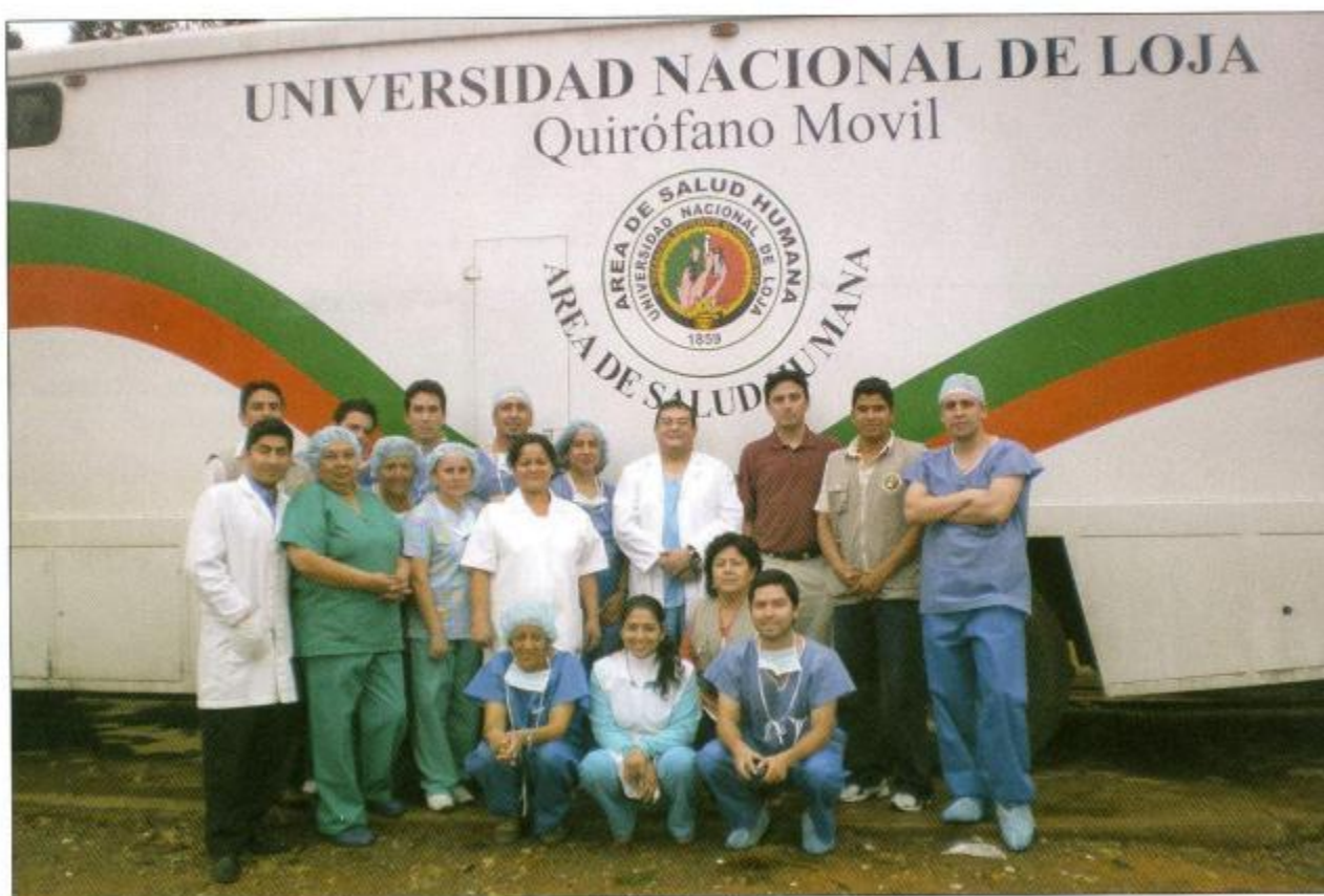
QUIRÓFANO MÓVIL. PERSONAL MÉDICO DEL ASH Y DEL HOSPITAL DEL IESS, QUE ATIENDEN A LA COMUNIDAD EN DIFERENTES SECTORES DE LA PROVINCIA.

talentamiento y legitimación social, en un ejercicio pleno de su capacidad y potencialidad del conocimiento y de la técnica, en su autonomía, para reconstituirse, para regenerarse e influir en una nueva relación Estado-Sociedad-Universidad.