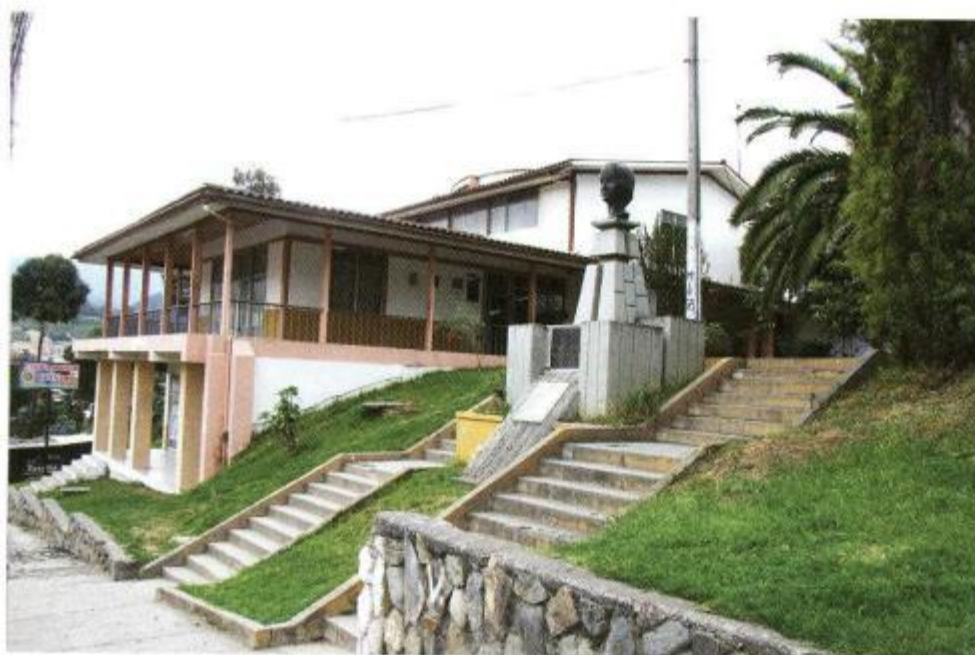
ASH, INSTALACIONES EN LA PARTE SUPERIOR DEL HOSPITAL DOCENTE "ISIDRO AYORA CUEVA". AL CENTRO, BUSTO DE MATILDE HIDALGO DE PROCEL.

pueblos no podrán gozar de los otros derechos que les vienen dados, por así decirlo, por añadidura. Sobre la buena salud se construye y descansa la educación, el trabajo, la realización del ser humano en todos los campos y según sus particulares aptitudes.