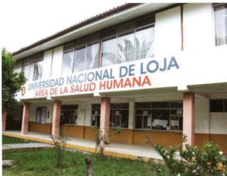
AMBIENTES DEL ASH.