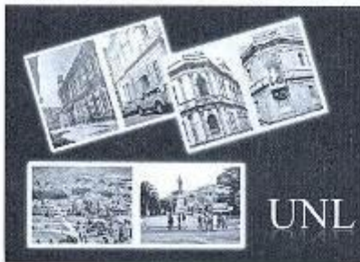
Prospectiva de la Universidad Nacional de Loja.

Así también, es necesaria la internacionalización de las finanzas, haciendo un análisis respecto a la nueva propuesta del Banco del Sur, a la nueva propuesta de la moneda virtual y porque no, luego a la moneda latinoamericana o suramericana, como lo tiene Europa con el euro, ya que eso nos permitirá