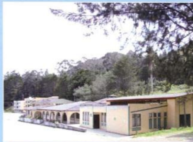
Ambientes del Área de Energía