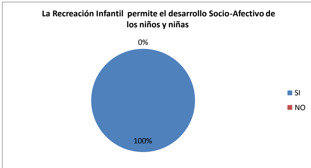
GRÁFICO Nro. 3