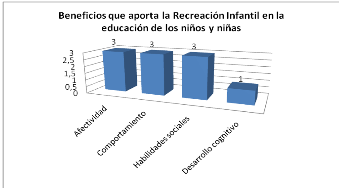
GRÁFICO Nro. 4