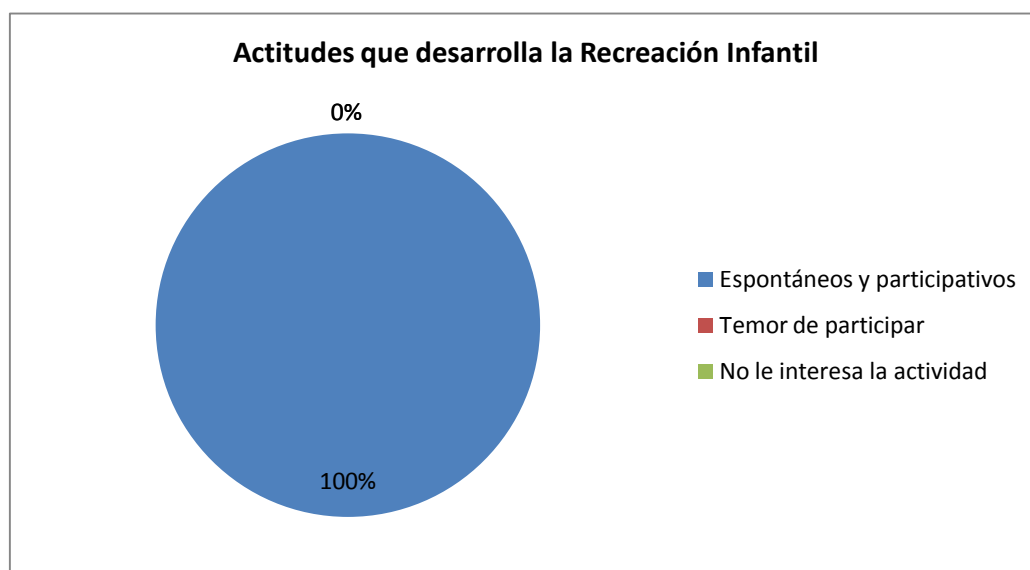
GRÁFICO Nro. 5