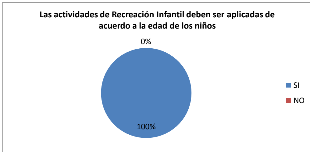
GRÁFICO Nro. 6