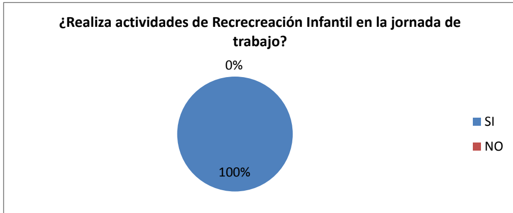
GRÁFICO Nro. 1