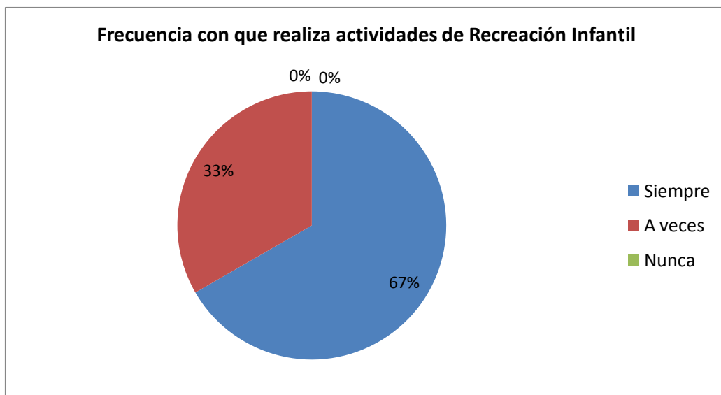
GRÁFICO Nro. 2

Fuente: Encuestas a maestras del Centro de Educación Inicial “Luz y Vida” Investigadora: Martibel Rezabala Plaza