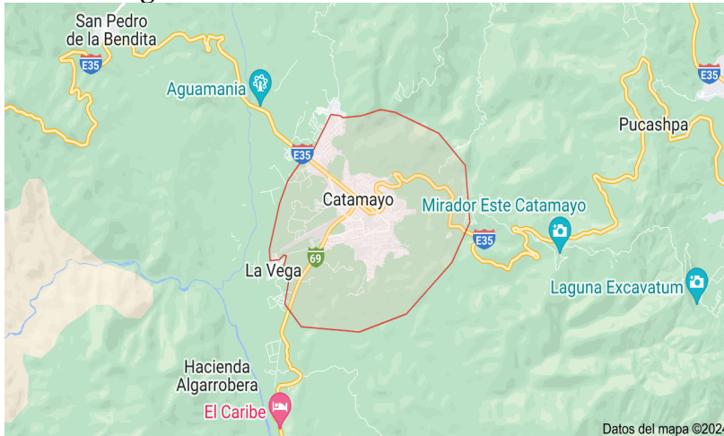
Ubicación del Cantón Catamayo