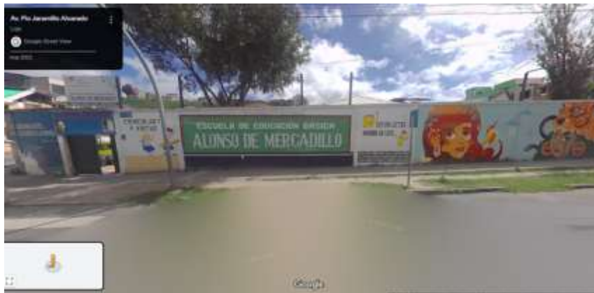
Figura 2. Escuela de Educación Básica “Alonso de Mercadillo”