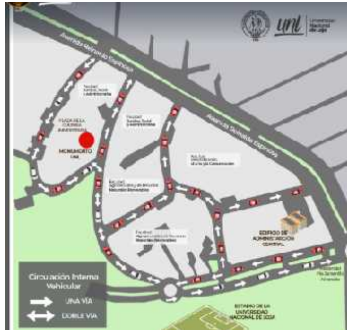
Figura N°. 1. Ubicación del Campus Universitario