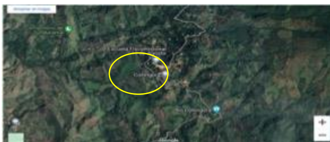
Figura N°. 1. Barrio Collingora – Loja

El presente trabajo investigativo se ejecutó en el barrio Collingora cuenta con una población aproximada de 215 habitantes, entre los cuales se identifican 25 personas con discapacidad, según datos proporcionados por el Consejo Nacional para la Igualdad de Discapacidades (CONADIS). La mayor parte de los residentes en esta zona dependen de actividades agropecuarias para su sustento, enfrentando limitaciones económicas que impactan su calidad de vida y restringen su acceso a recursos de salud y educación. La ruralidad del área, sumada a la topografía accidentada y a la falta de infraestructura adecuada, afecta directamente a las personas con discapacidad, quienes deben sortear barreras físicas y sociales que limitan su integración y participación en la vida comunitaria. La ubicación geográfica de Collingora, en una zona fronteriza y apartada de los principales centros urbanos de la provincia de Loja, resalta la necesidad de políticas inclusivas que promuevan la accesibilidad y la igualdad de oportunidades. Estas características geográficas y socioeconómicas hacen de Collingora un espacio que demanda intervenciones específicas orientadas a mejorar las condiciones de vida de sus habitantes con discapacidad, así como a garantizar su acceso a servicios y su integración en la sociedad local (INEC, 2022).