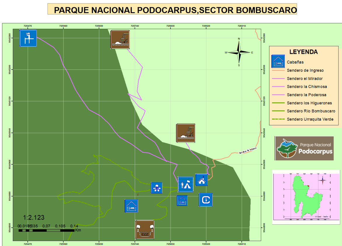
Figura 2. Mapa del circuito turístico con sus respectivos atractivos y recursos turísticos.

Basado en el diagnóstico turístico previo se ha podido determinar un atractivos y tres recursos turísticos que integrarán el Circuito Turístico los mismos que poseen características fundamentales para ser visitados por los turistas, su accesibilidad y el estado de conservación, cercanía hacia la ciudad de Zamora y las diversas actividades complementarias, que se pueden realizar en el lugar permiten ofrecer una experiencia llena de placeres a quienes realizan el recorrido. En la tabla 2 se muestra la clasificación del atractivo y los recursos turísticos más relevantes del Parque Nacional Podocarpus, Sector Bombuscaro, donde el recorrido se lo realizara según el mapa presentado en la Figura 2.