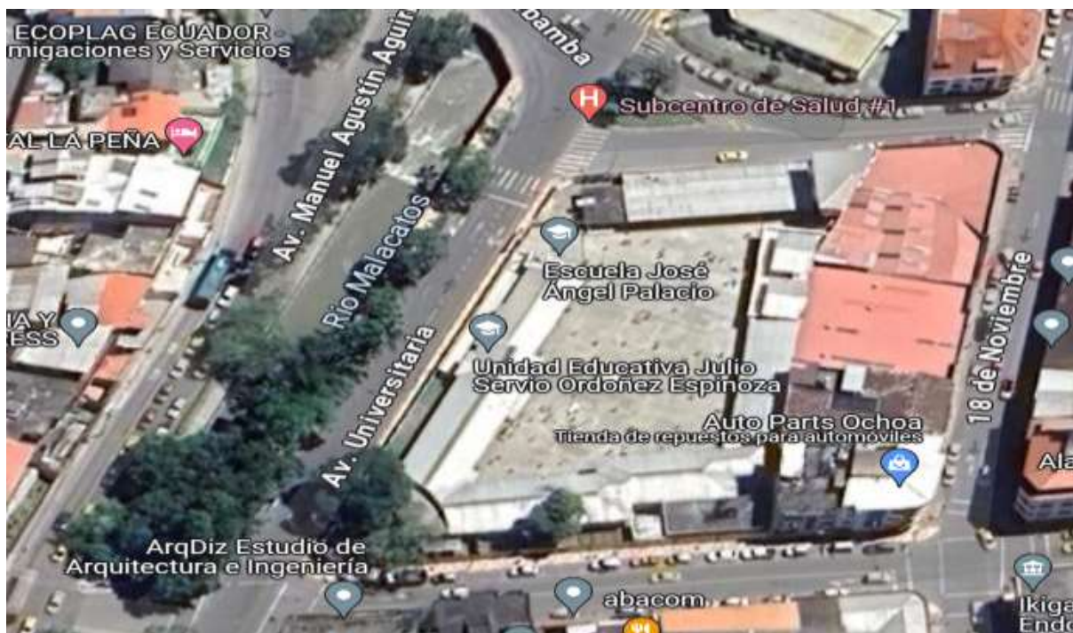
Figura 1. Croquis de la Institución