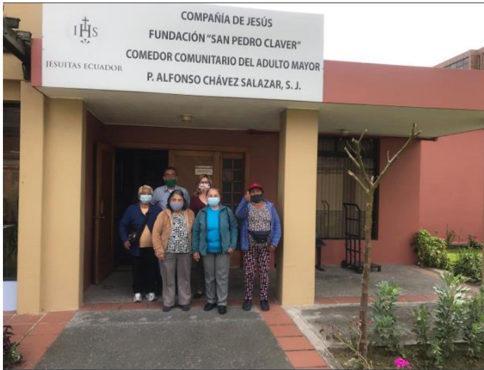
Ilustración 2 Entrada Principal