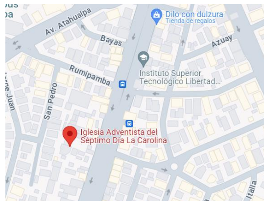
Figura 1: Club de Conquistadores - Google Maps

también fomentar un ambiente de aprendizaje enriquecido por diversas perspectivas y experiencias.