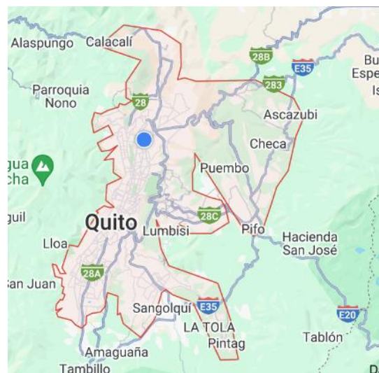
Figura 2: Mapa de la ciudad de Quito - Google Maps

( https://maps.app.goo.gl/XnOL8GGRoPcCRukX7 )