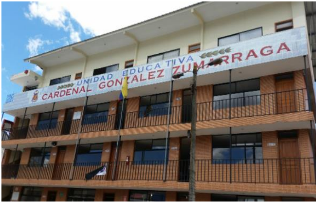
Figura 1. Unidad Educativa González Zumárraga.