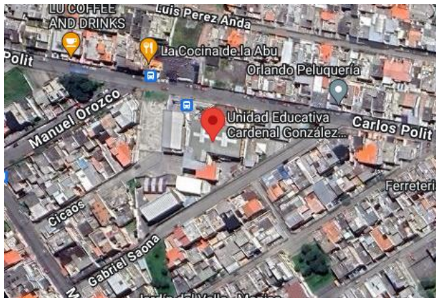
Figura 2. Mapa de ubicación zonal de la Unidad Educativa González Zumárraga.