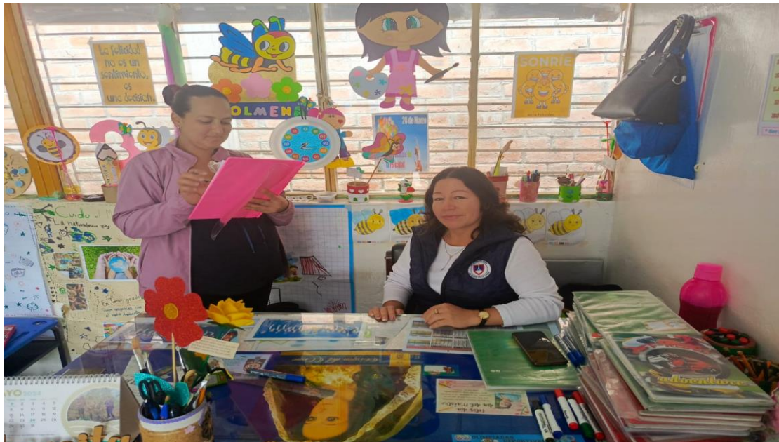
Figura 2. Aplicación de entrevista a docente