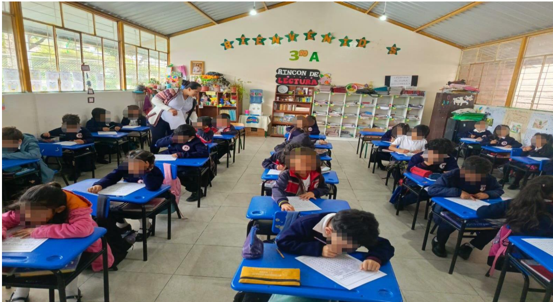
Figura 3. Observación a estudiantes