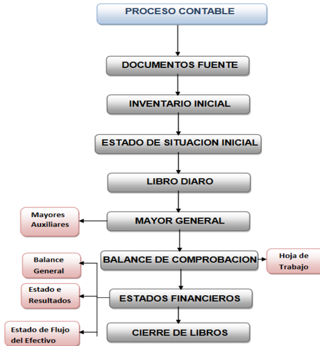
Figura 1 Proceso contable

Nota: La figura indica los pasos para la realización de proceso contable. Fuente Zapata Sanches (20011).