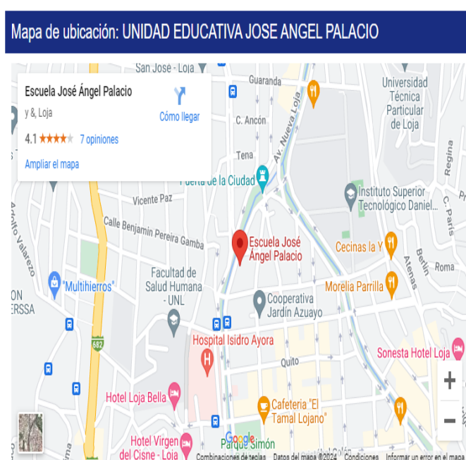
Figura 1. Unidad Educativa José Ángel Palacio. Escenario en el que se realizó la investigación.

La presente investigación se desarrolló en la Unidad Educativa José Ángel Palacio , identificada con su código de institución educativa 11H3057, correspondiente a la zona 7, geográficamente es un centro educativo urbano, ubicada en las calles Av. Universitaria, Juan De Salinas y Pasaje Rodríguez de la provincia de Loja, Cantón Loja, parroquia El Sagrario, oferta un tipo de educación regular con nivel educativo de Educación Inicial, Educación General Básica y Bachillerato en las secciones matutina y vespertina en modalidad ordinaria y Bachillerato extraordinario intensivo en la sección nocturna, con un sostenimiento fiscal, régimen escolar sierra, modalidad presencial, y jornada matutina y vespertina. Tiene un total de 103 docentes y 1002 estudiantes, si cuenta con un Departamento de Consejería estudiantil; el cual, cuenta con una profesional capacitada como una psicóloga educativa.