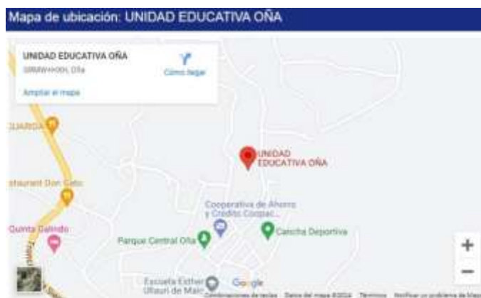
Figura 1. Unidad Educativa Oña. Escenario en el que se realizó la investigación.