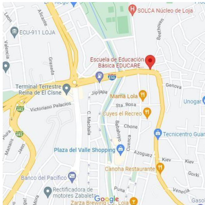
Figura 1. Escenario en el que se realizó la investigación. Escuela de educación básica particular “San Andrés”.

El presente trabajo de investigación se realizará en la Escuela de Educación Básica Particular “San Andrés”, ubicada en la provincia y cantón Loja, sector La Argelia, parroquia San Sebastián en la Av. Pío Jaramillo Alvarado entre Galileo Galilei y Albert Einstein, oferta un tipo de educación regular con nivel educativo de Educación General Básica, con un sostenimiento privado, régimen escolar sierra, modalidad presencial, y jornada matutina. Tiene un total de 13 docentes y 86 estudiantes, cuenta con un departamento de consejería estudiantil, que da la ayuda solicita dependiendo a cada caso.