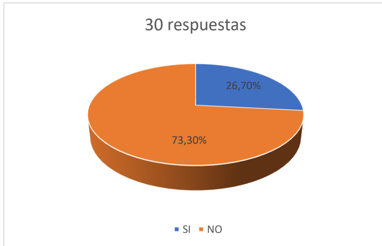
Figura N.º 1

Fuente: Profesionales del Derecho de la ciudad de Loja Autora: Carmen Herminia Armijos Herrera