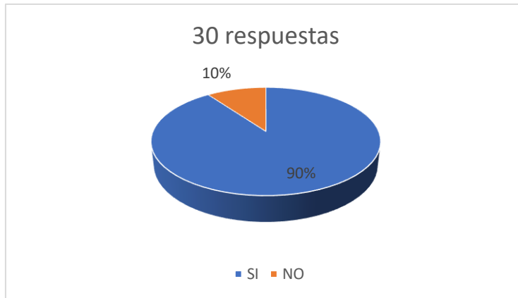
Figura N.º 3