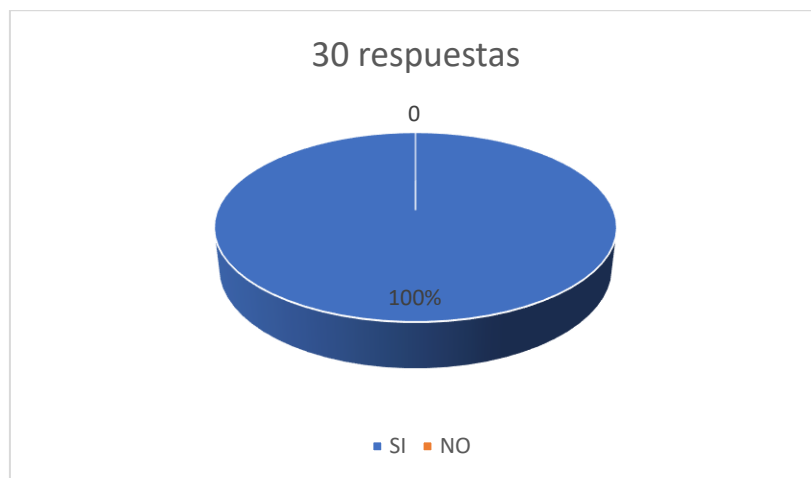
Figura N.º 2