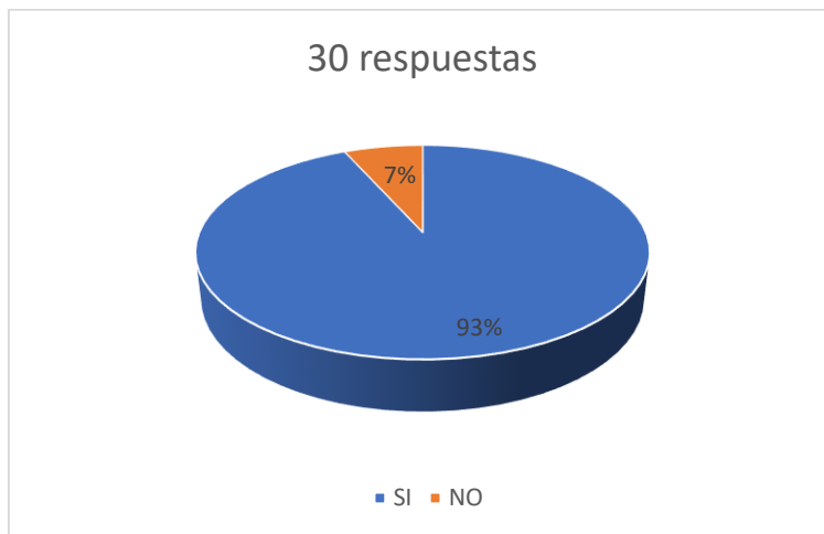
Figura N.º 5

Fuente: Profesionales del Derecho de la ciudad de Loja Autora: Carmen Herminia Armijos Herrera