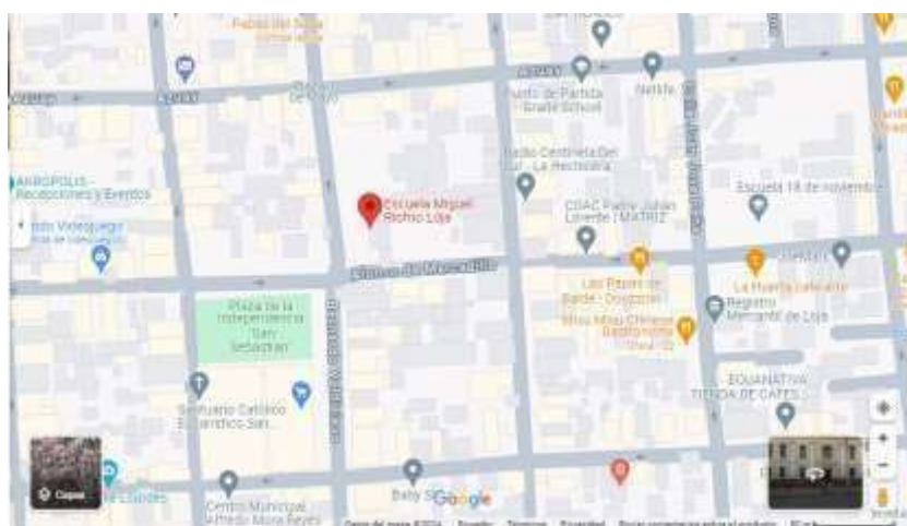
Figura 1. Ubicación de la escuela "Miguel Riofrío"

Nota: la imagen muestra la ubicación de la escuela Miguel Riofrío.