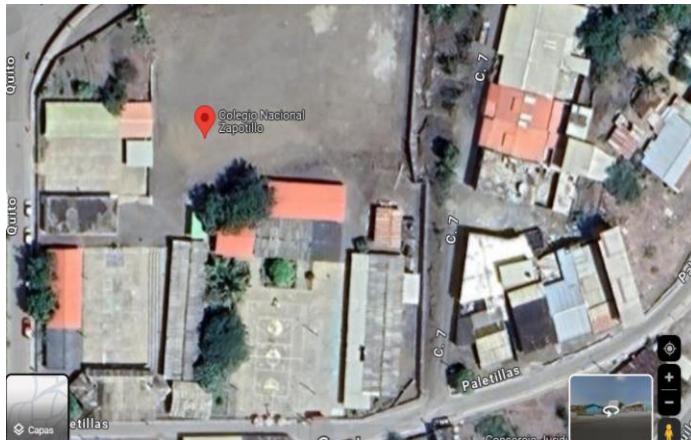
Figura 1 Ubicación del Colegio de Bachillerato Zapotillo.

En la Figura 1 se observa la localización y ubicación del Colegio de Bachillerato Zapotillo.