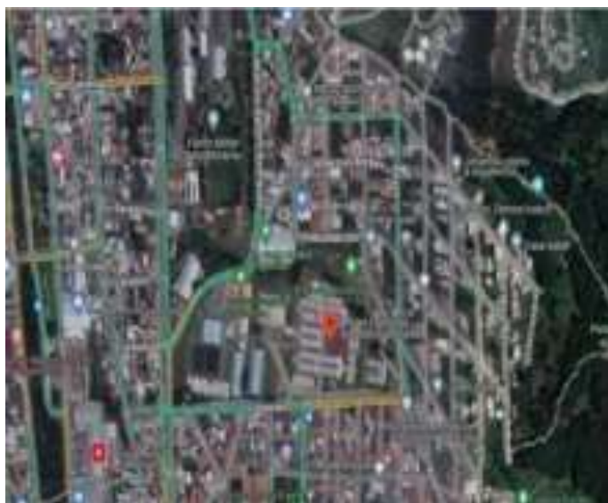
Figura 1. Unidad Educativa del Milenio Bernardo Valdivieso, escenario en el que se realizó la investigación.