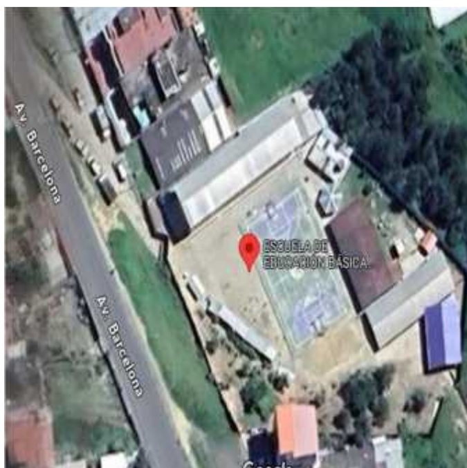
Figura 1. Escuela "Rosa Josefina Burneo de Burneo" Escenario en el que se realizó la investigación

Nota: Tomado de Google maps ( https://maps.app.goo.gl/VZXd5ofNj83c7adz9 )