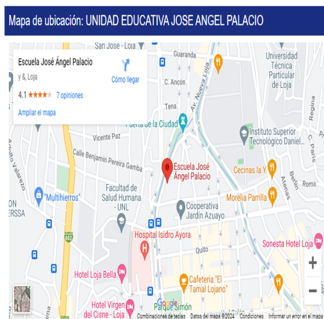
Figura 1. Unidad Educativa José Ángel Palacio. Escenario en el que se realizó la investigación.

La presente investigación se desarrolló en la Unidad Educativa José Ángel Palacio , identificada con su código de institución educativa 11H3057, correspondiente a la zona 7, geográficamente es un centro educativo urbano, ubicada en las calles Av. Universitaria, Juan De Salinas y Pasaje Rodríguez de la provincia de Loja, Cantón Loja, parroquia El Sagrario, oferta un tipo de educación regular con nivel educativo de Educación Inicial, Educación General Básica y Bachillerato en las secciones matutina y vespertina en modalidad ordinaria y Bachillerato extraordinario intensivo en la sección nocturna, con un sostenimiento fiscal, régimen escolar sierra, modalidad presencial, y jornada matutina y vespertina. Tiene un total de 103 docentes y 1002 estudiantes, si cuenta con un Departamento de Consejería estudiantil; el cual, cuenta con una profesional capacitada como una psicóloga educativa.