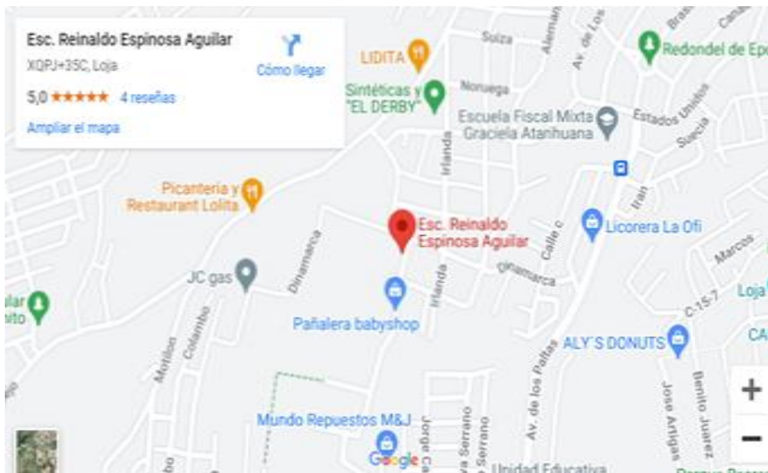
Figura 1. Croquis de la EB "Reinaldo Espinosa Aguilar"