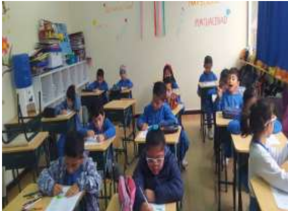
Aplicación de la evaluación diagnóstica.