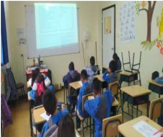
Aplicación de talleres.