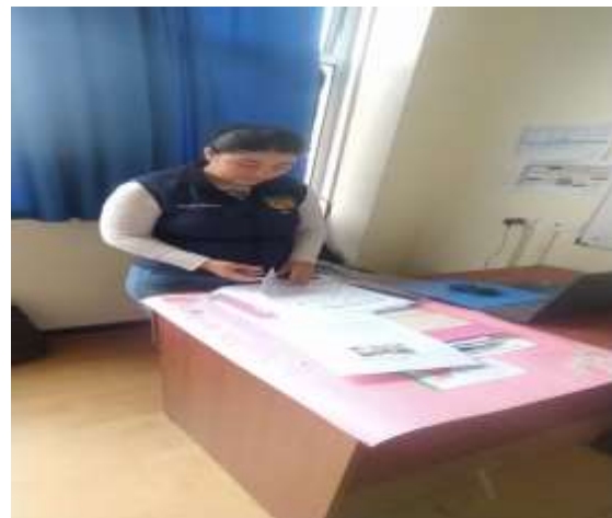
Entrevista a la docente.