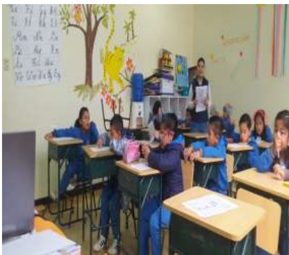
Aplicación de taller.