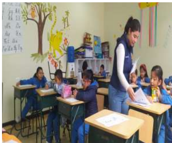
Aplicación de taller.