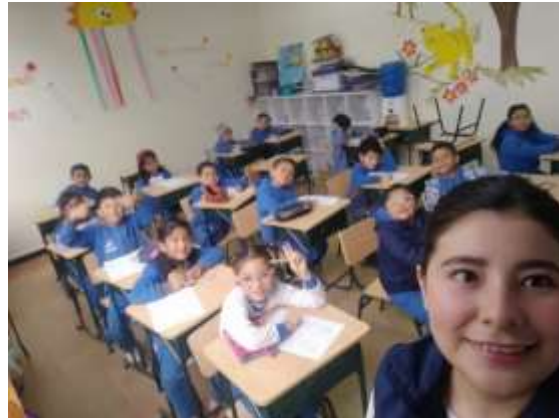
Con los niños de tercer grado "B".