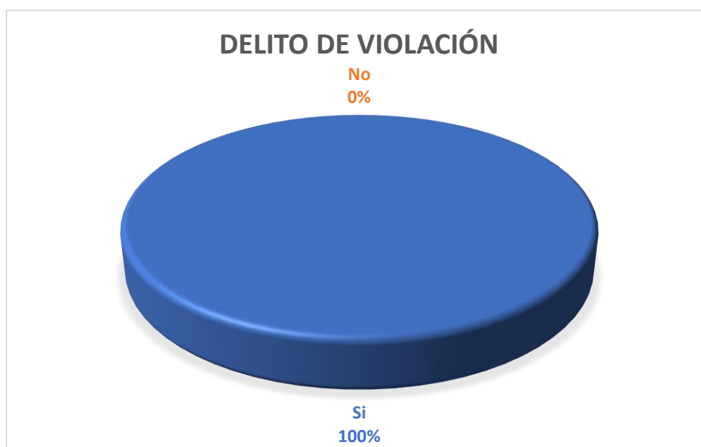
Gráfico Nro. 1

Fuente: Encuestas realizadas por la investigadora. Autor: Estibaliz Almudena Sánchez Valdivieso.