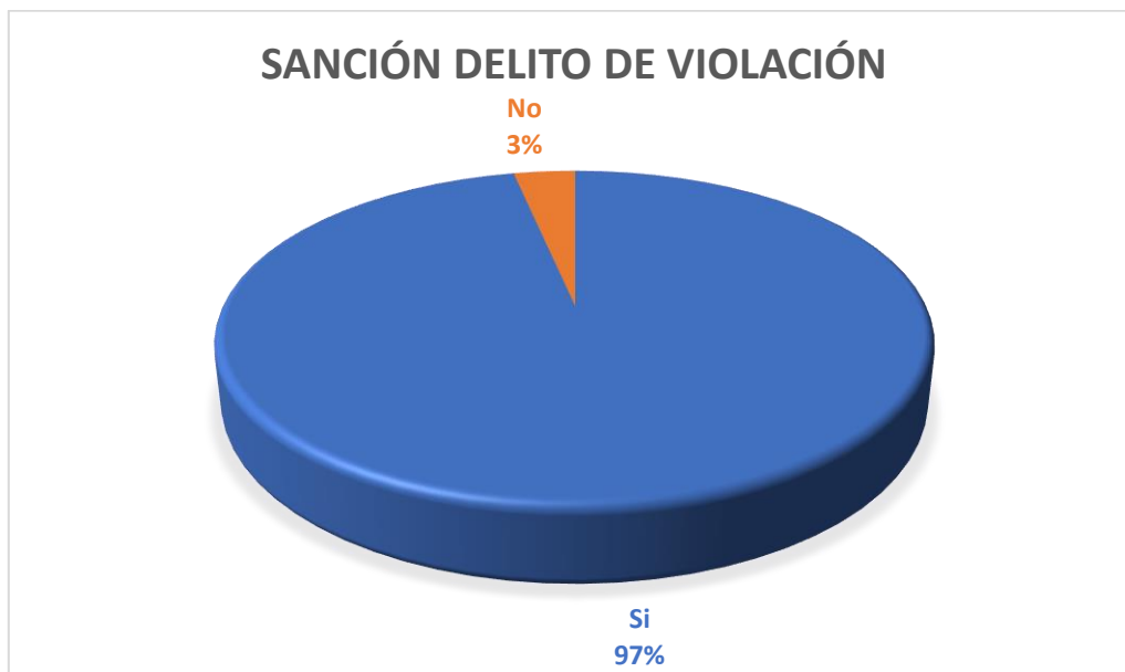
Gráfico Nro. 2

Fuente: Encuestas realizadas por la investigadora. Autor: Estibaliz Almudena Sánchez Valdivieso.