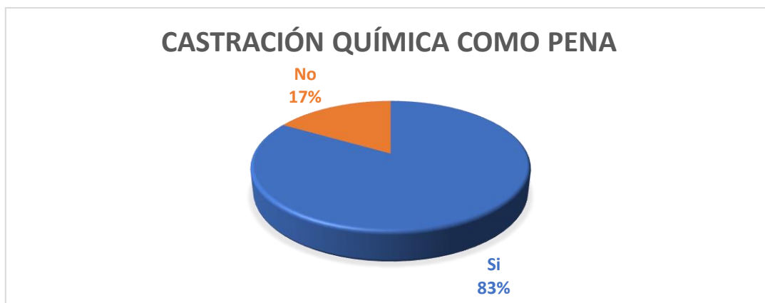
Gráfico Nro. 6

Fuente: Encuestas realizadas por la investigadora. Autor: Estibaliz Almudena Sánchez Valdivieso.