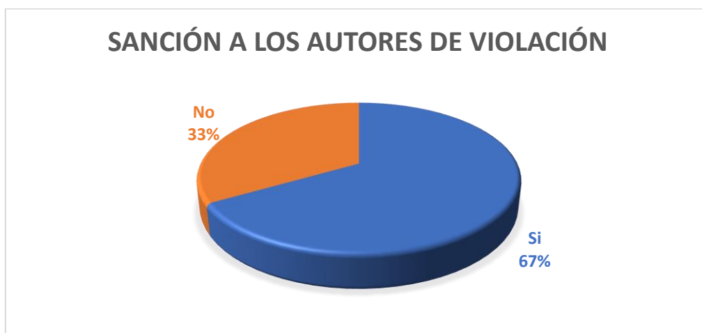
Gráfico Nro. 5

Fuente: Encuestas realizadas por la investigadora. Autor: Estibaliz Almudena Sánchez Valdivieso.