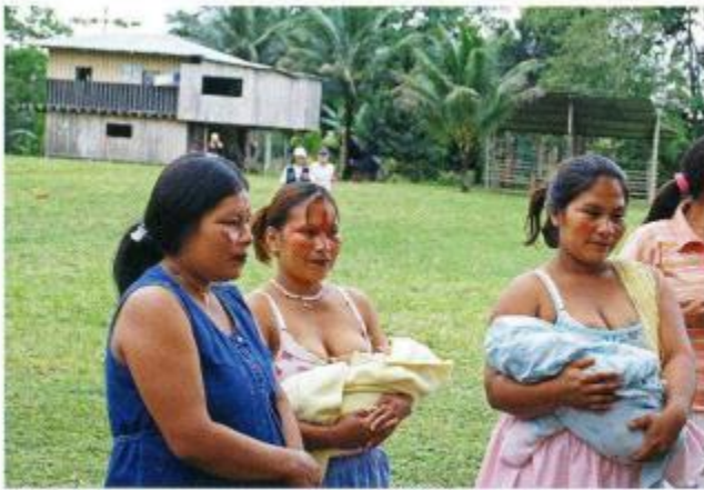
Figura 3. Mujeres de una comunidad nativa en Napo, Ecuador.

La población amazónica ecuatoriana tiene dos estructuras culturales principales: por un lado, existen al menos 10 grupos étnicos que han ocupado estos territorios desde antes de la época colonial -se sabe que los territorios que hoy pertenecen al Ecuador estuvieron habitados desde unos 10 mil años A.C., por pueblos que migraron desde Asia y Oceanía (Ayala 2002); y por otro, la población mestiza que ha ingresado a la Amazonia, en busca de mejorar sus condiciones de vida, como consecuencia de la presión demográfica y la explotación del petróleo.