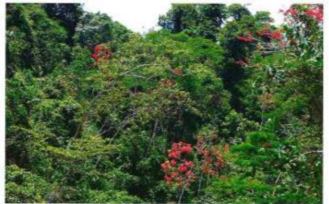
Figura 9. Bosque natural de la Amazonia Sur

El Centro ha definido y viene desarrollando políticas que viabilicen su accionar, las mismas que se expresan en la constitución de equipos interdisciplinarios ; búsqueda de alianzas estratégicas con actores del gobierno nacional y local, con organizaciones sociales y organismos internacionales; impulso de procesos de desarrollo pertinentes con los diferentes espacios territoriales, sociales y culturales; promoción de programas interdisciplinarios de formación de posgrado; valoración y difusión permanente de los conocimientos ancestrales y de aquellos construidos en el accionar del CEDAMAZ y el impulso a la producción agroecológica .