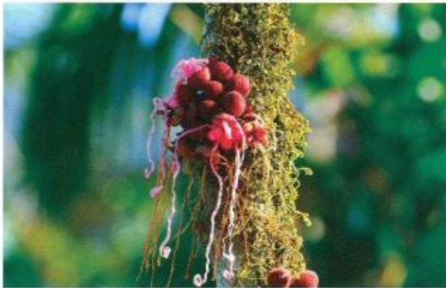
Figura 4. Flor del apai Grias sp, fruto consumido por las comunidades amazónicas.

Ambos grupos humanos, con diferentes culturas, actividades económicas, organización y cosmovisiones, han entrado en contacto produciéndose un choque cultural con ventajas y desventajas para las dos partes.