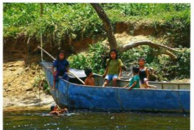
Figura 10. Niños de la Comunidad Shuar, que viven en armonía con la naturaleza.