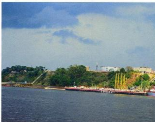
Figura 1. Complejo petrolero en Manaus, Brasil.

Según OTCA (2004), existen alrededor de 370 grupos étnicos en toda la Amazonia, con diferentes cosmovisiones, depositarios de un incalculable bagaje de conocimientos y tecnologías propias, que les han permitido vivir en armonía con la naturaleza por infinidad de años. El mismo autor señala que los pueblos ancestrales amazónicos son extractivistas y hasta hace poco vivían exclusivamente en y del bosque, extrayendo productos del ecosistema como animales y plantas.