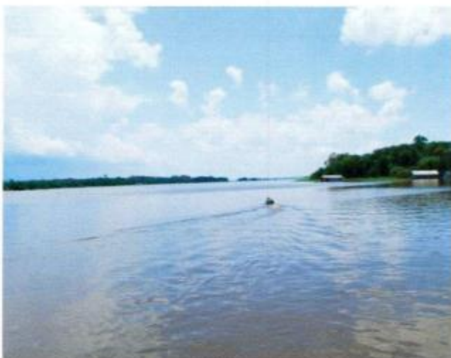
Figura 2. Encuentro de las Aguas del Río Negro con el Solimoes, Brasil.

La Amazonia Ecuatoriana tiene 132.000 km 2 , que representa el 48 % del territorio nacional y 90 % del trópico húmedo ecuatoriano. Es la región con la mayor cobertura boscosa y una biodiversidad muy alta; incluye seis provincias: Sucumbíos, Napo, Orellana, Pastaza, Morona Santiago y Zamora Chinchipe y 42 cantones. No es un territorio vacío, en él viven 546 602 habitantes (30 % lo constituyen comunidades nativas), con un crecimiento poblacional acelerado del 7,5 % anual (INEC 2002).