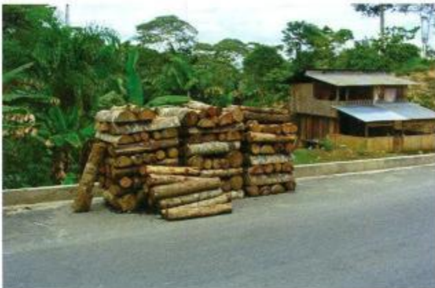
Figura 8. Madera que se extrae del bosque, para uso en construcción de viviendas y para la venta.