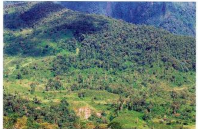
Figura 5. Paisaje de la Amazonia Sur, donde se puede observar algunos parches de suelo desnudo y pastizales en medio del bosque producto del cambio de uso del suelo y la deforestación.

En resumen se puede apreciar que existen visiones e intereses contradictorios que complejizan la situación de la región, y más aún sus perspectivas de desarrollo equitativo y sustentable. Esto genera propuestas de desarrollo no pertinentes con la realidad amazónica, por ejemplo la homogenización de la educación, los cambios en los patrones alimentarios, programas de colonización mal planificados, conducen a la precariedad de las condiciones de vida de las poblaciones, la pérdida de los recursos naturales renovables y agudizan el empobrecimiento de los suelos.