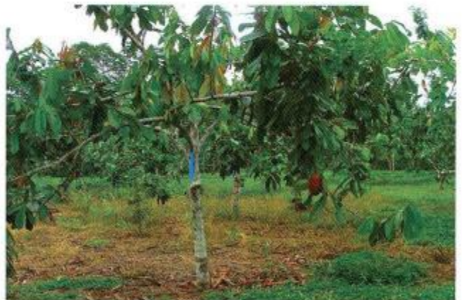
Figura 6. Plantación de cacao Theobroma cacao en la Estación de INIAP en San Carlos, provincia de Orellana.