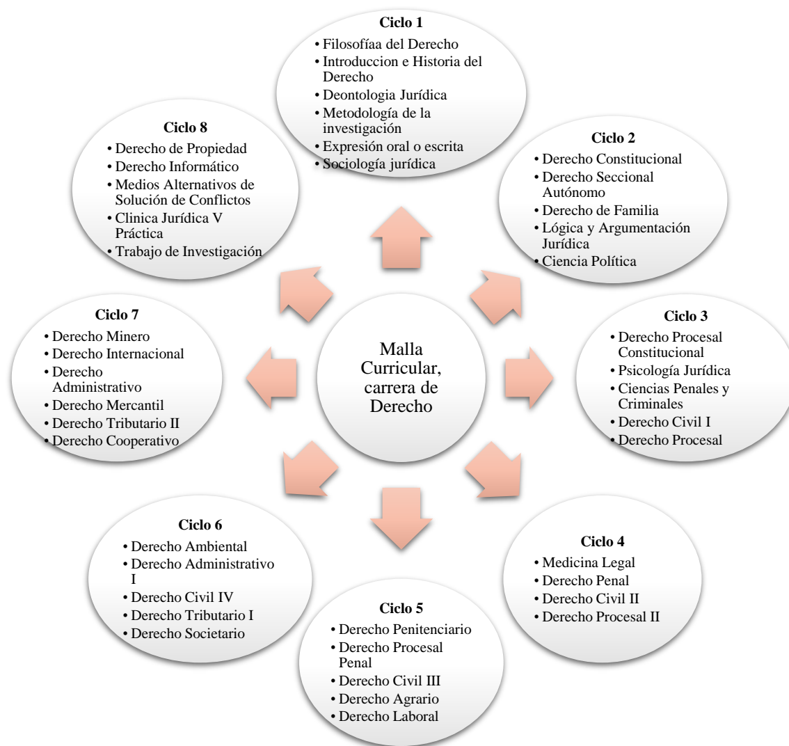
Figura. 4. Malla curricular de la carrera de Derecho de la UNL.