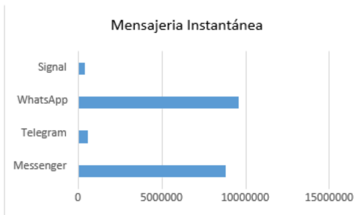
Figura 3.- Mensajería Instantánea