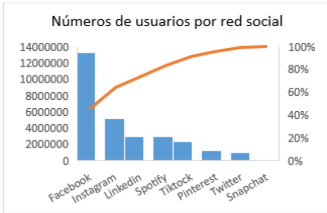
Figura 1.- Número de usuarios por red social en Ecuador.

Las redes sociales con mayor número de usuarios tenemos: Facebook, Instagram, Tiktok, Twitter, Spotify, LinkedIn, Pinterest y Snapchat y en mensajería instantánea WhatsApp, Messenger, Telegram y Signal.