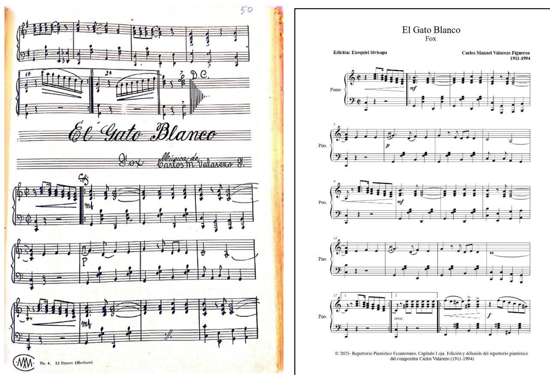
Escaneado con CamSc

A la izquierda se encuentra el facsímil original perteneciente al archivo del Repertorio Pianístico Ecuatoriano. A la derecha se encuentra la partitura editada. Obra “El gato blanco”