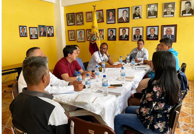
Ilustración 1: Reunión con la mesa intersectorial del cantón Calvas.

Nota: En base a los resultados, mantuvimos una reunion para exponer la prevalencia de violencia de género en mujeres del cantón Calvas y luego programar las acciones a realizarse.