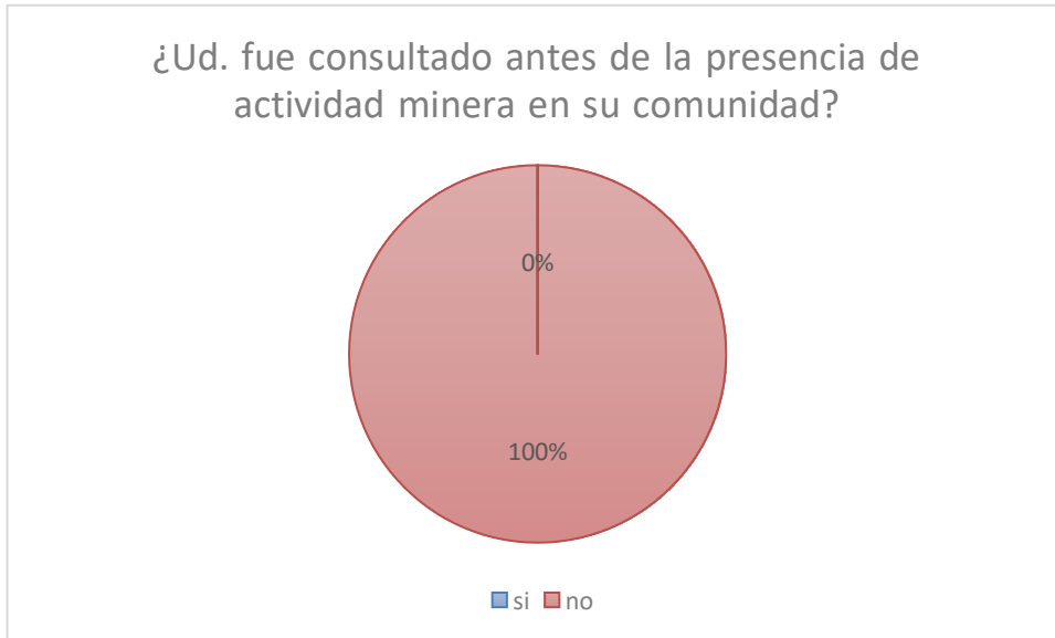
Gráfico No. 2