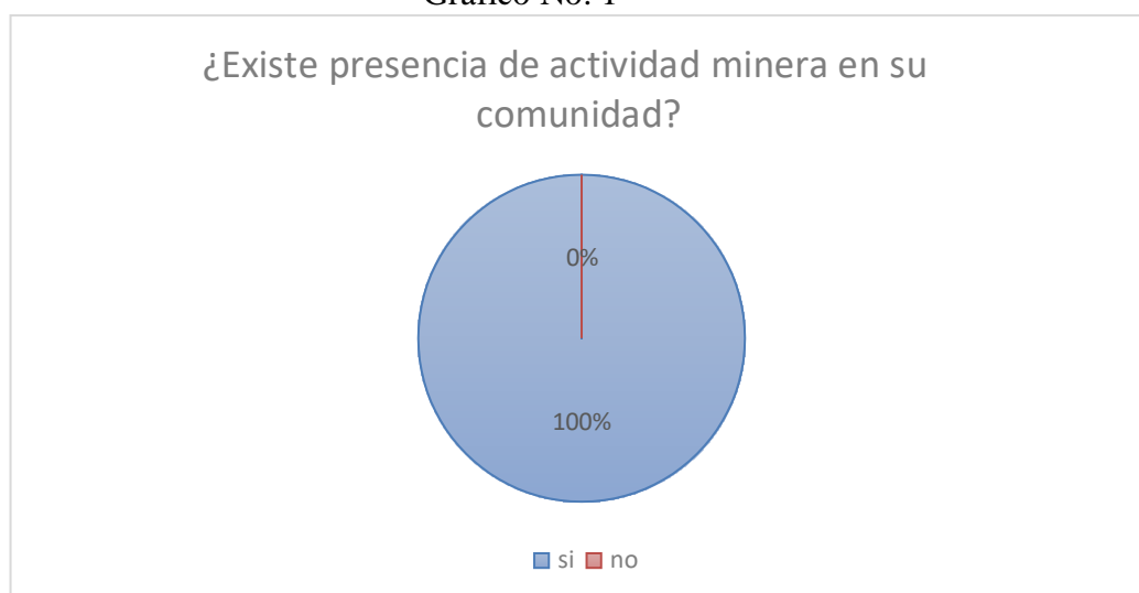
Gráfico No. 1

Pregunta Uno: ¿Existe presencia de actividad minera en su comunidad?