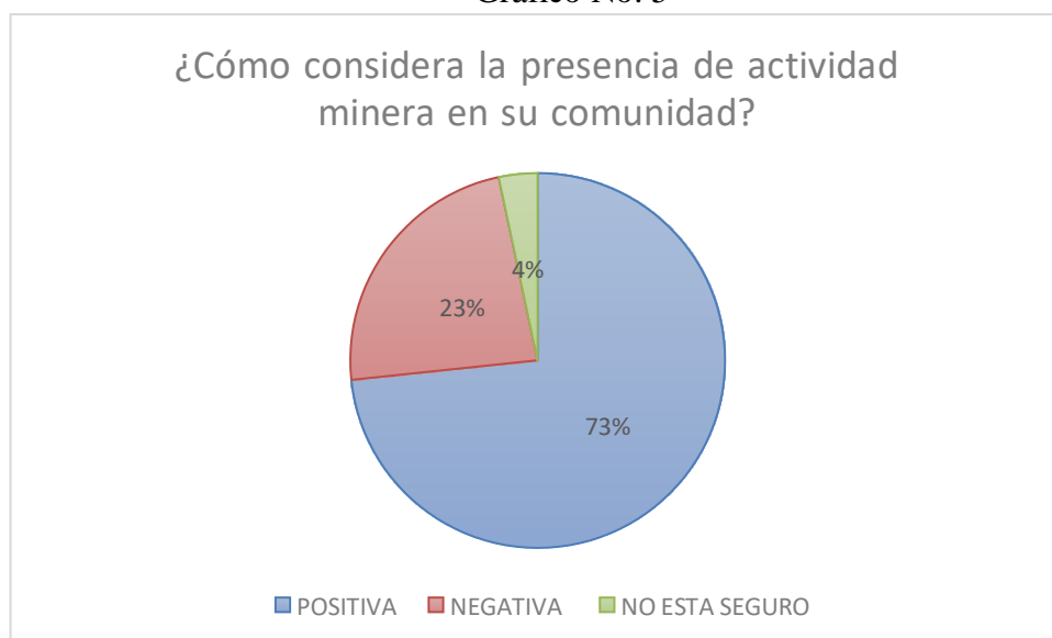
Gráfico No. 5