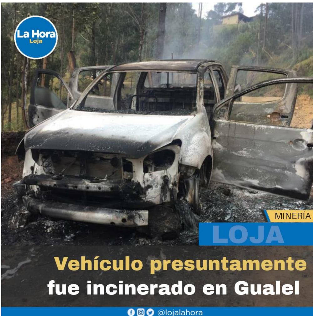
Fuente: La Hora, 2020, camioneta de la empresa minera Guayacán Gold incinerada en el enfrentamiento del 15 de octubre en Gualal.