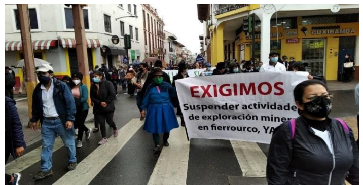
Imagen 2. Marcha en contra de la minería