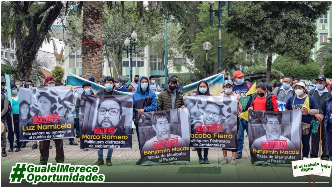
Imagen 6. Personas identificadas como antimineras.

Fuente: Minería Contigo, 2022, exposición de algunos personajes identificados como antimineras durante el plantón a favor de la minería en la provincia de Loja.