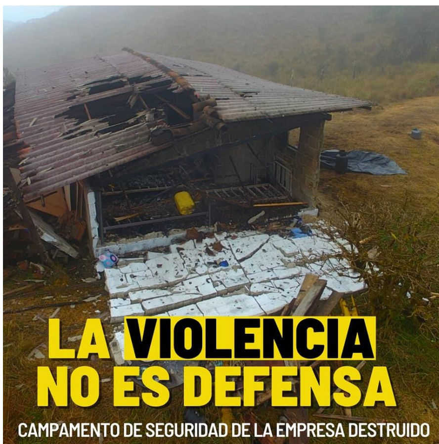
Imagen 5. Viviendas e Insumos Quemados

daños ocasionados a la empresa minera Guayacán Gold, a causa del enfrentamiento con habitantes de la parroquia de San Pablo de Tenta, el 13 agosto de 2021 sector Loma del Oro.