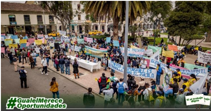
Imagen 1. Marcha a favor de la minería

Fuente: Minería Contigo, 2022, marcha a favor de la minería el 3 de febrero de 2022 en el cantón Loja.