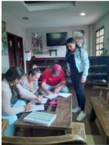
Grupo Focal con el Departamento de información Turística de Vilcabamba