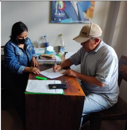
Aplicación de la Metodología a los encargados del ITUR