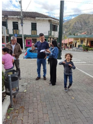
Aplicación de la Metodología adaptada