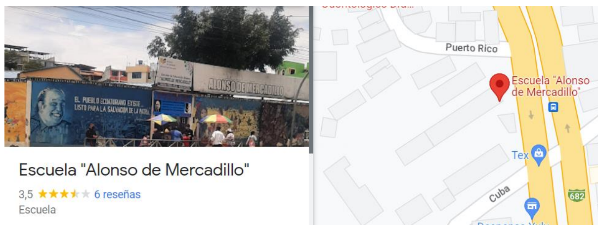
Figura 1. Croquis de la escuela de Educación Básica “Alonso de Mercadillo”

“La Escuela “Alonso de Mercadillo” en los próximos cinco años será una institución educativa de excelencia en todos los niveles, que alcance los estándares de aprendizaje, líder en la innovación, investigación científica y tecnología, con un equipo de docentes de alta calidad humana y profesional comprometidos con la educación Holística del estudiante y enmarcados en los principios básicos del Buen Vivir”.