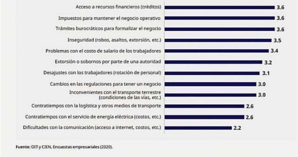
Figura 2 Afectación por tipo de problema (calificación sobre 5)

Nota. Información sacada de la Organización Internacional del trabajo (OIT); Centro de Investigaciones Económicas Nacionales (CIEN) y elaborada por la Organización Internacional del Trabajo 2021, EBM & Asociados