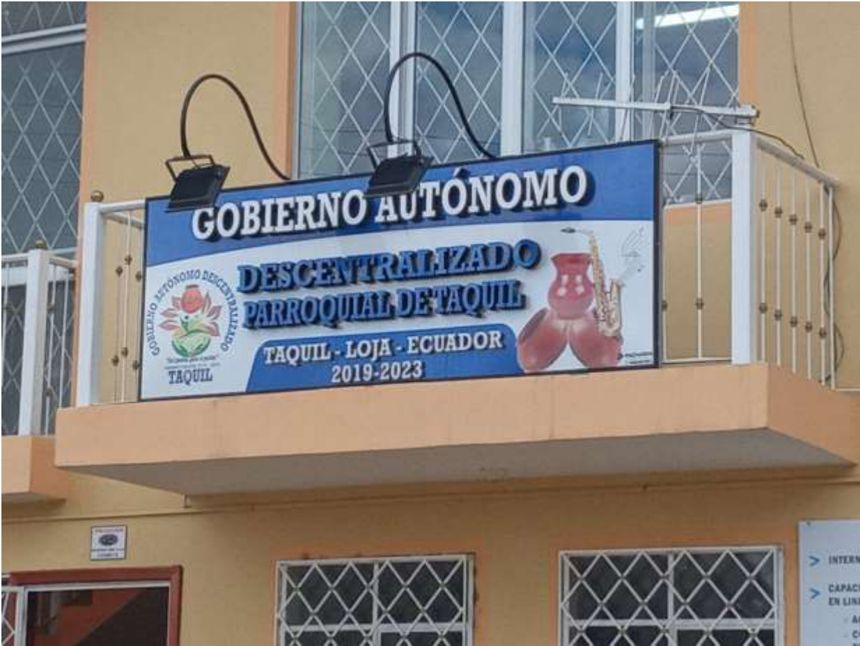
Nota: infraestructura de la junta parroquial de Taquil