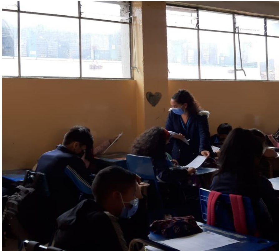
FOTOGRAFIA 2. APLICACIÓN DE REACTIVOS PSICOLÓGICOS A ESTUDIANTES DE 8VO AÑO DE EGBS DE LA UNIDAD EDUCATIVA PIO JARAMILLO ALVARADO