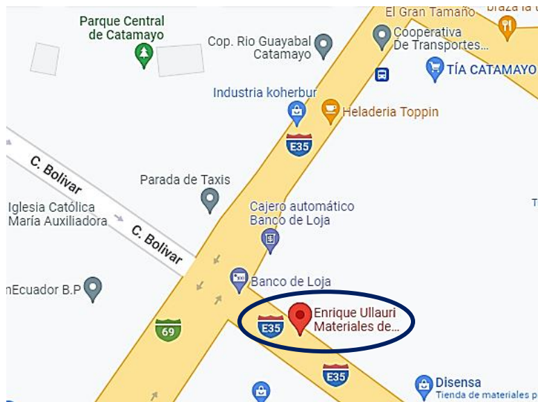
Figura 1. Ubicación de la empresa Enrique Ullauri

La empresa Enrique Ullauri materiales de construcción Cia. Ltda se sitúa en el cantón Catamayo, provincia de Loja en la zona céntrica de la ciudad, entre las calles Bolívar y Avenida Catamayo a pocos pasos del Banco de Loja.