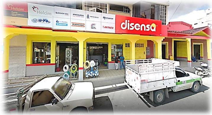
Figura 2. Empresa Enrique Ullauri materiales de construcción

El 7 de septiembre del 2004, mediante un acto jurídico, la compañía Enrique Ullauri materiales de construcción Cia. Ltda se constituyó por escritura pública ante el Notario Séptimo del Cantón Loja y fue aprobada por la Delegación de la Superintendencia de Compañías en Loja, mediante Resolución N0.4-DSCL.142, el 29 de septiembre del mismo año con un capital social de $800.