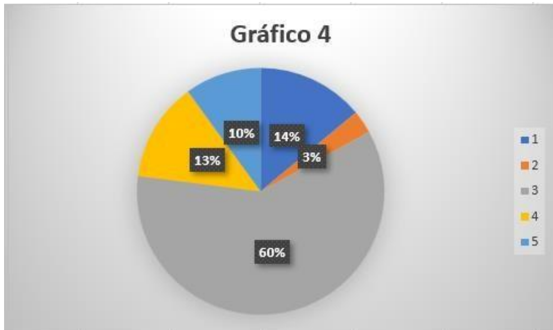
Figura 4 Derechos que se vulneran con el cometimiento del delito de violación

Interpretación: En la presente pregunta, 4 encuestados que corresponden al 14%, señalan que los derechos que se vulneran con el cometimiento de este delito el derecho a elegir sobre su cuerpo, porque consideran que ante tal acto es necesario y sumamente importante tener decisión, otros encuestados consideran que se vulnera este derecho ya que se le está quitando el derecho de libertad, además se debe tomar en cuenta que al no brindar seguridad ni para elegir sobre qué hacer o no con su cuerpo, se está generando miedo con