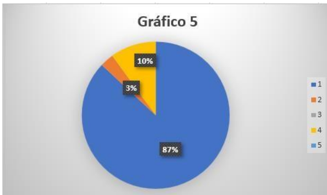
Figura 5 Derechos que se vulneran con la aplicación de la pena de muerte

Interpretación: En la presente pregunta, 24 encuestados que corresponden al 87%, señalan que si se afecta o se vulnera el derecho a la vida efectivamente, porque evidentemente se está vulnerando el derecho fundamental como es la vida, por ende, no se está de acuerdo a la aplicación de la pena de muerte pero si a dar opciones como la castración, para que se evite lo él cometimiento de delitos que implique la vulneración de la integridad sexual y personal; mientras que 3 personas que representan al 10%, opinan que existen otros delitos vulnerables al sancionar de este tipo como lo es la pena de muerte porque consideran que al violentarse la integridad pueden causar daños y vulneraciones de otro tipo de delitos como la libre decisión, es decir que los delitos que se consideren necesario de acuerdo a la gravedad se puede optar por una aplicación de pena de muerte como sanción. Además de esto se toma en cuenta que las alteraciones dentro del planteamiento legal existen es por ello que al momento de dar sentencia o sanción no se procede adecuadamente.