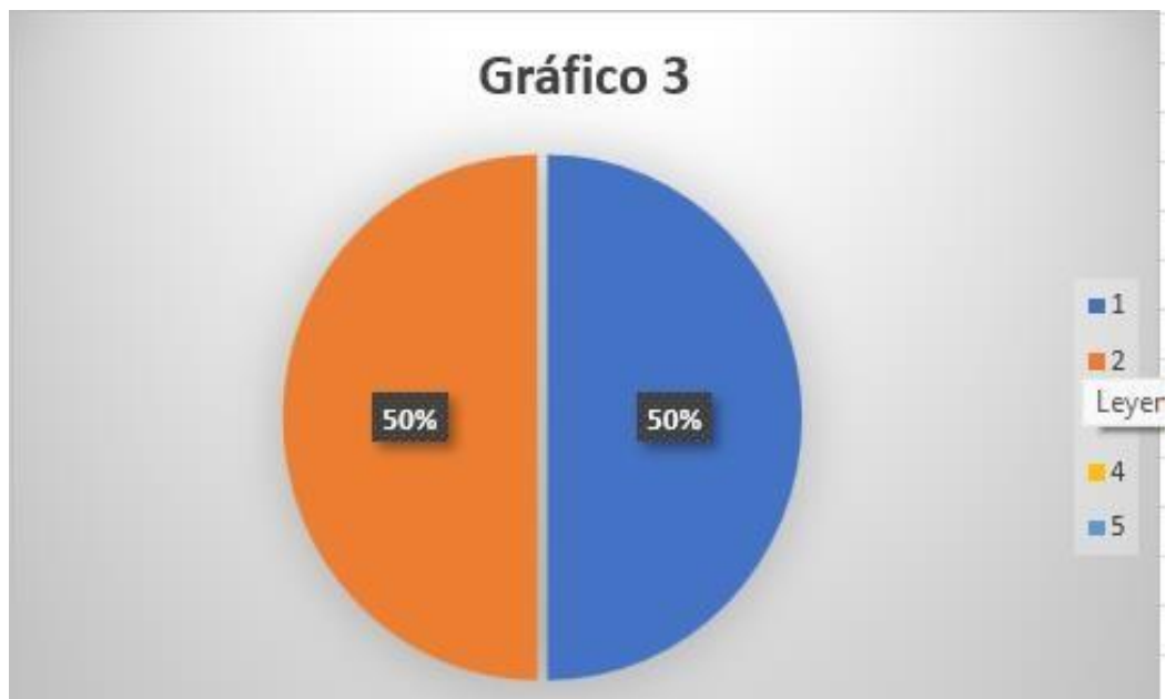
Figura 3 ¿Considera usted pertinente que acorde a los daños psíquicos y psicológicos que causa este delito a sus víctimas se debe aplicar la sanción de pena de muerte?

Interpretación: En la presente pregunta, 15 encuestados que corresponden al 50%, señalan que si se debería aplicar la pena de muerte tomando en consideración los daños que se ocasionaron por el cometido delito, porque consideran que el causar ese tipo de daños son irreversibles, ya que quien es víctima de tan irreparable daño en ciertas ocasiones no le es fácil continuar con el desarrollo normal de su vida, tomando en cuenta los miedos o