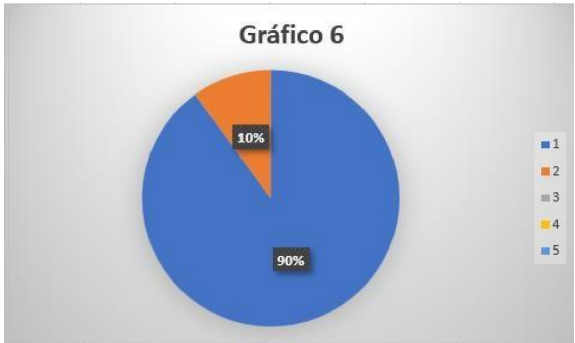
Figura 6 ¿Está usted de acuerdo con la presentación de una propuesta de reforma legal, a fin de garantizar a la víctima el efectivo derecho a la integridad sexual y reproductiva, así como la integridad personal?

Interpretación: En la presente pregunta, 27 encuestados que corresponden al 90%, señalan que si se es posible una reforma para la aplicación de la pena de muerte porque sustentan sus argumentos en que de igual forma se estaría violentando la vida de personas dignas por ende se estaría violentando la vida mismo, es decir que se procedería con una respectiva reforma cuando se proceda con un estudio criminológico para determinar las afectaciones que en realidad ameriten una sanción tan severa, de otras opiniones también es necesario recatar que la procedencia para una reforma es importante conocer el cómo se debería hacerlo; mientras que 3 personas que representan al 10%, opinan que no se procedería a la reforma por el simple hecho que en nuestra legislación no se puede aplicar por la negación constitucional y tratados Internacionales, en los que se determina que no podrá existir ni darse por ningún motivo la vulneración al derecho fundamental como es la vida.